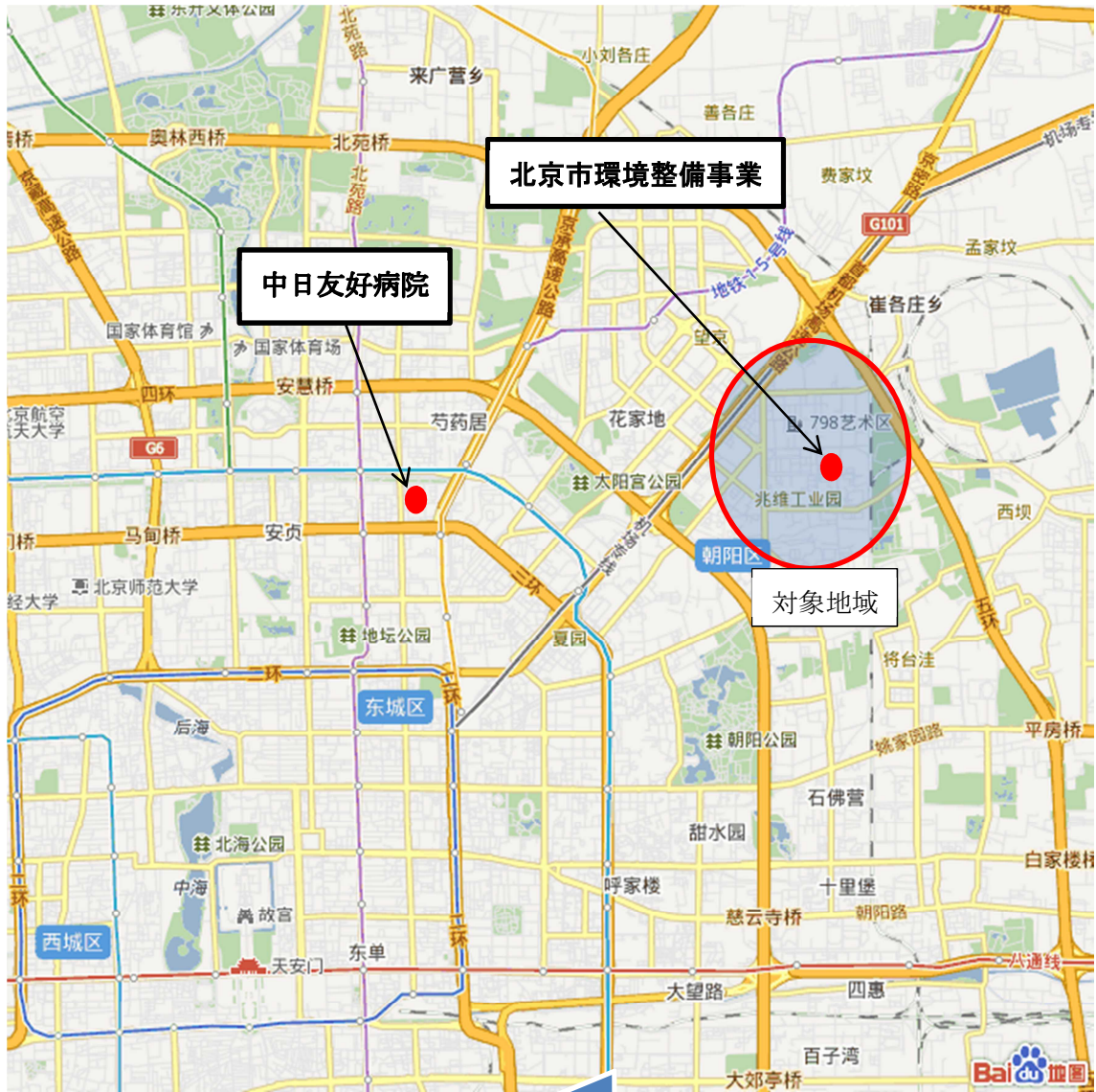
視察案件位置图（北京市）