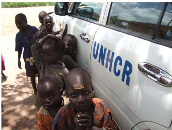
（写真）オピットIDPキャンプにて

本議員団は、UNHCR関係者及び本キャンプを運営するイタリアNGO・AVSIの案内により視察を行った。