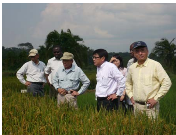
(写真) コメ振興支援(ナムロンゲ試験場)

我が国は、ウガンダの開発ニーズに合致しつつ、我が国の経験と知見がいかされ比較優位が発揮される分野に重点を置いて開発援助を進めてきた。具体的には、1997年7月の経済協力政策協議の際に両国政府が合意した①人的資源開発(教育、職業訓練等)、②基礎生活支援(保健・医療インフラ)、③農業開発(コメ振興、農産物付加価値向上等)、④経済基礎インフラ整備(道路、電力等)である。これらの4重点分野は、2006年10月の経済協力政策協議でもレビューされたが、これらの分野のニーズは依然大きなものがあり、それぞれの分野で我が国が支援実績を重ねその経験・専門知識を一層いかすためにも、引き続きこれら4重点分野を中心にウガンダを支援していくことで両国の意見の一致を見ている。