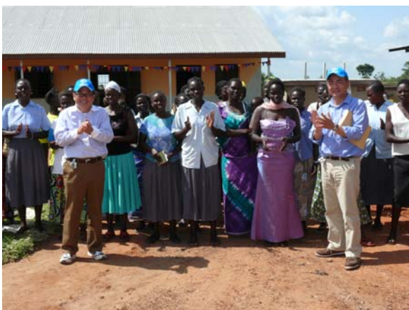
(写真) テラ・ルネッサンス職業訓練センター

元子ども兵だけでなく帰還民も、外部の援助に頼る生活に慣れてしまっている。和平交渉の進展により人道・緊急支援から復興開発に向けた支援に移行する中で、どのようにエンパワーメントしていくかが課題である。