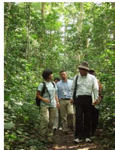
（写真）マビラ森林保護区

赴任2年目に入り、配属先の意向を尊重して環境教育にも更に力を入れて活動することとなり、現在、視覚教材の製作、近隣の小中学校や、他の隊員の任地へ出張授業を行っている。