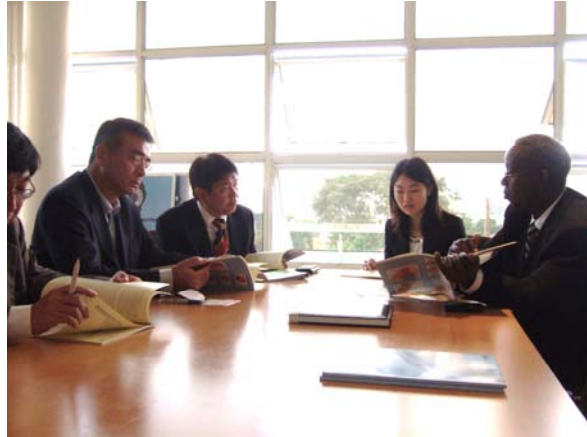
(写真) エイズ委員会における意見交換

委員会の任務は、(a)すべてのH I V／エイズ政策及びプログラムと国家戦略計画の全体構想計画との調整、(b)H I V／エイズ政策及びプログラムの履行の障害となっているものの特定、(c)プログラムの活動と対象の確実な実施と到達、(d)H I V／エイズ抑制プログラムのための資金の調達、(e)H I V／エイズ抑制プログラムの資金監視、(f)ウガンダにおけるH I V／エイズのまん延とその結果に関する情報の提供である。