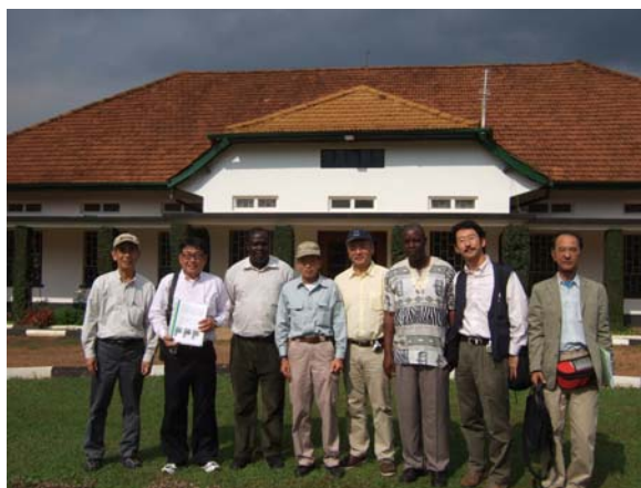
（写真）ナムロンゲ農業試験場

我が国は今後も引き続きウガンダを東南部アフリカにおけるネリカ米普及の中心に位置づけ、ケニア、マラウイ、エチオピア、ジンバブエ、タンザニア等の近隣諸国における巡回指導を行うと同時に、ウガンダにおいてセミナーを開催し、近隣国の研究者・行政官