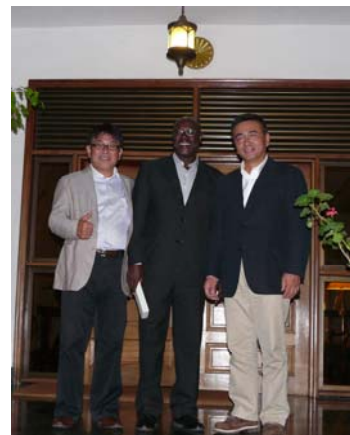
(写真) ババ副大統領府国務大臣との意見交換を終えて

ネリカ米の普及には課題もある。今までのウガンダの農法は雨を待つだけのものであったが、近年大雨と干ばつが周期的に来るようになっており、乾燥に強いネリカ米とはいえ、灌漑システムの整備が必要である。