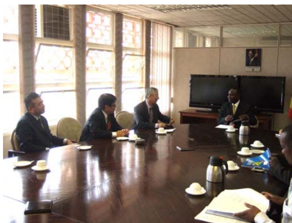
(写真) 財務計画経済開発省における意見交換

(これに対し当方より、国会で議論したいと述べたほか、加藤在ウガンダ大使より、TICAD IVのフォローアップとしてアフリカへの我が国の投資を促進すべく、9月中にもアフリカ貿易・投資促進合同ミッションがウガンダを訪問する予定である旨紹介があった。)