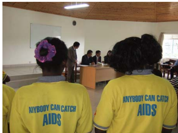
（写真）TASO訓練センター

本プロジェクトにより、本訓練センターで開催される研修プログラムを受講する国内外のNGO、国内政府機関に所属するカウンセラー・地域医療保健従事者、年間約280名が直接的に裨益している。