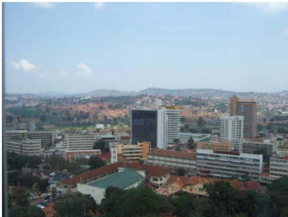
（写真）カンパラ市内の様子

輸入：ケニア（34.6%）、ア首連（8.7%）、中（7.2%）、印（5.6%）、南ア（5.5%）