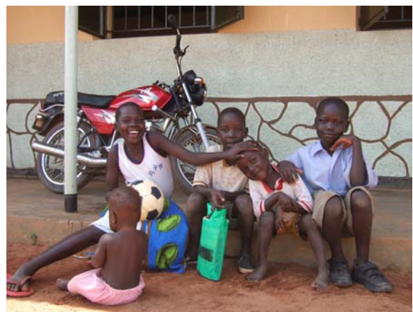
(写真) 同センターの元子ども兵士