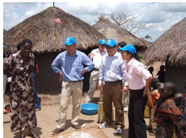
（写真）オピットIDPキャンプにおける視察