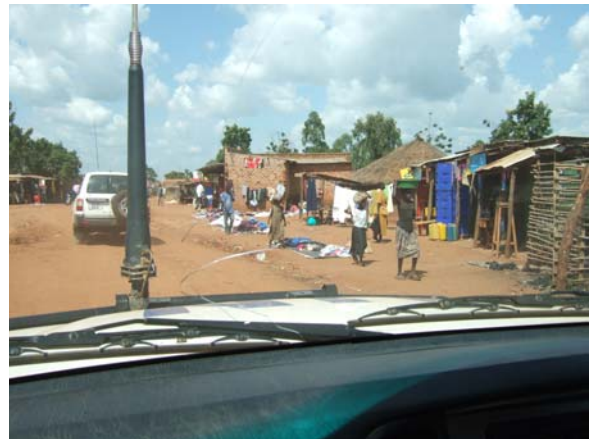
（写真）北部ウガンダ・グル市内の様子