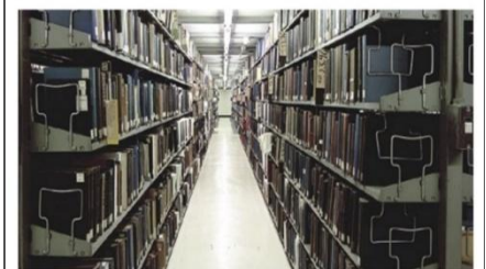
東京本館 本館書庫