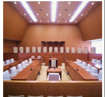
裁判官弾劾裁判所法廷