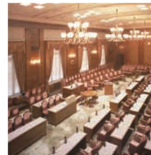
Зал комитетов №1