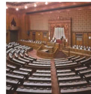
Зал Палаты советников