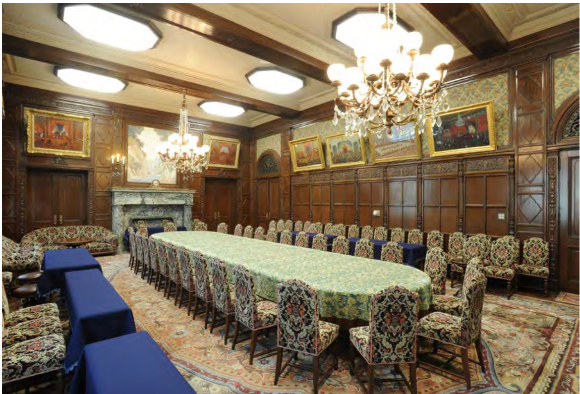
参议院议长接待室