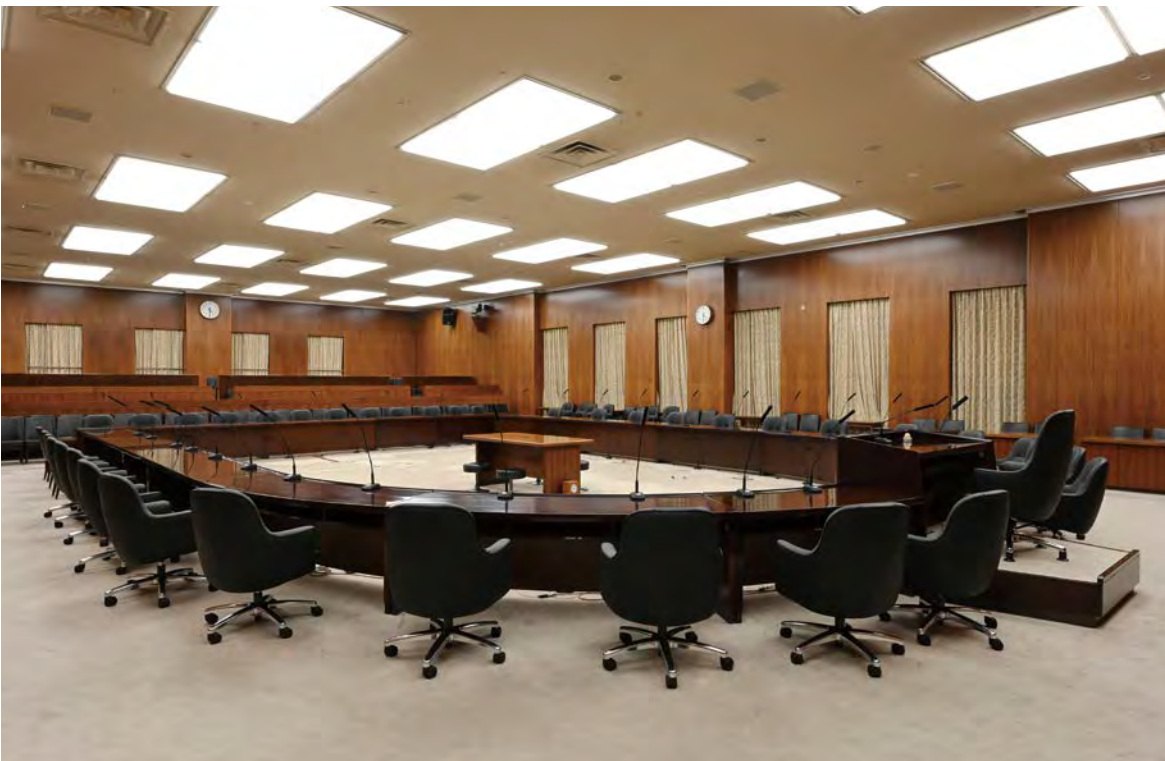
第 43 委员会会议室