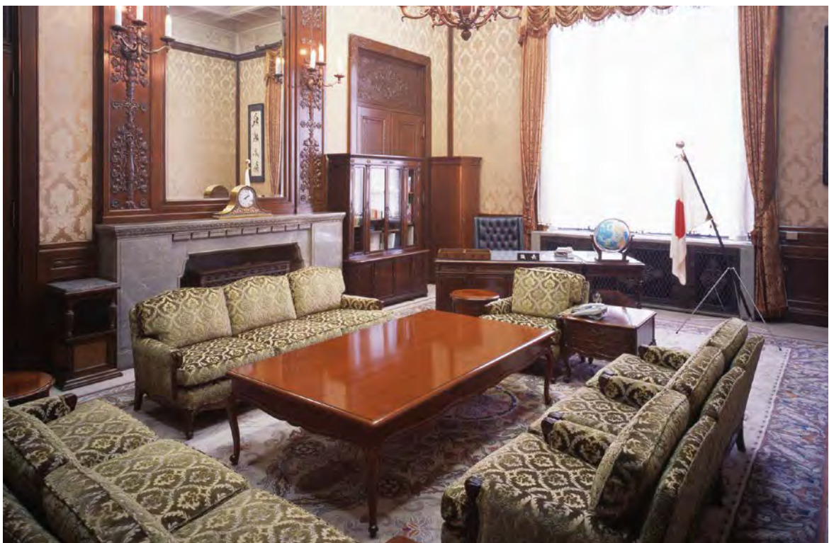
参议院议长的办公室

每届国会召开时天皇陛下都莅临国会议事堂出席开幕典礼。出席开幕典礼前，天皇陛下便在该休憩室小憩，并接见参众两院议长和副议长。