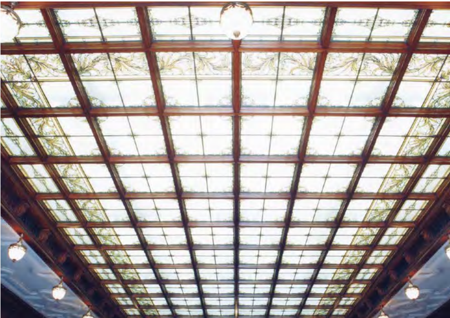
会议大厅的天花板