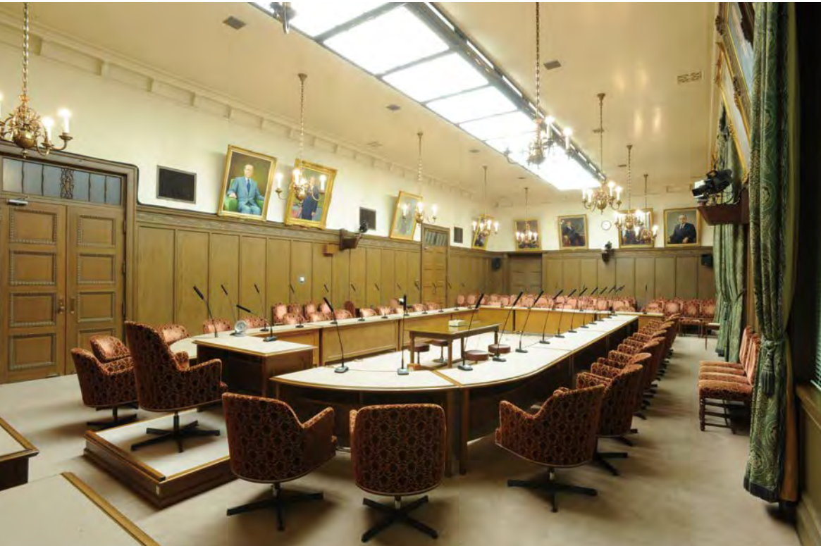
第 3 委员会会议室