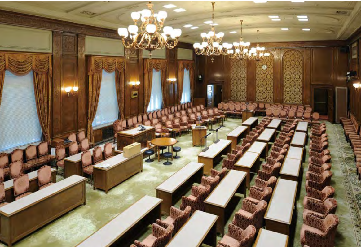
第 1 委员会会议室