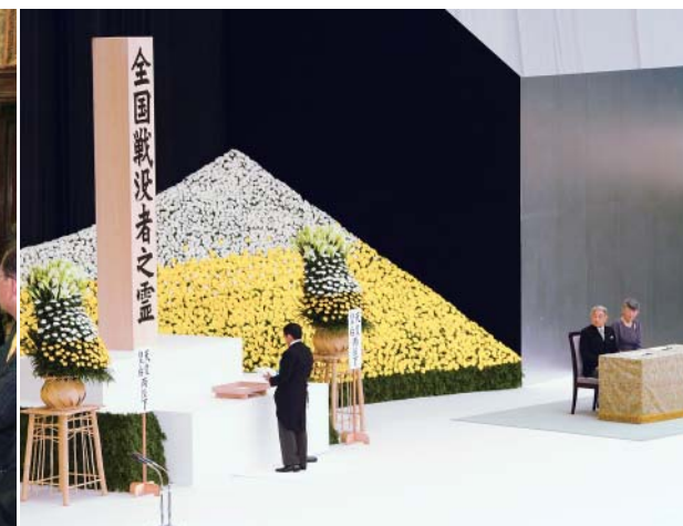
全国戦没者追悼式(日本武道館)