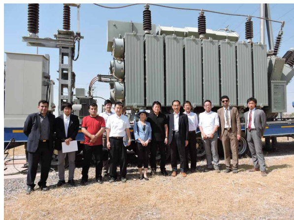
（写真）移動式変電所の前で