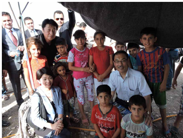
(写真) カワルゴスク・キャンプにて難民の子供たちと

「カワルゴスク・キャンプ」は、エルビル市中心部より北西方向約 25 キロの場所に設置されているシリア難民キャンプであり、約 1 万 3,600 人の難民が暮らしている。また、同キャンプから更に 10 キロほど北西に位置する「ハーゼル・キャンプ」は、「イスラム国」との戦闘に伴う国内避難民のキャンプであり、2014 年 7 月 30 日現在で 5,000 人が生活していると推定されているが、状況が流動的であるため、正確な数字は不明である。