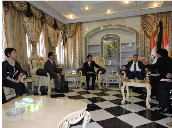
(写真) ハムラーンKRG財務・経済庁長官との懇談

(派遣団) イラクのクルディスタン地域が独立した場合、隣国に暮らす多くのクルド人や近隣国政府との関係について、どのように考えているか。