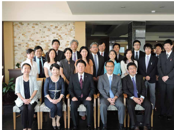
(写真) 懇談を終えて

派遣団は、イラク支援のために活動するJICAや国際機関、NGOの関係者のほか、現地に進出している日本企業関係者と懇談を行った。懇談には、JICA専門家のほか、国際機関のUNDP、UNHCR、UNAMI、NGOのIVY、PWJ、日本企業の住友商事（株）、豊田通商（株）、三井物産（株）から、それぞれ関係者が出席した。出席者からは、それぞれの活動状況や今後の課題、イラクにおける日本のプレゼンスと高い期待、継続的な支援の意義等について発言があり、率直な意見交換を行った。