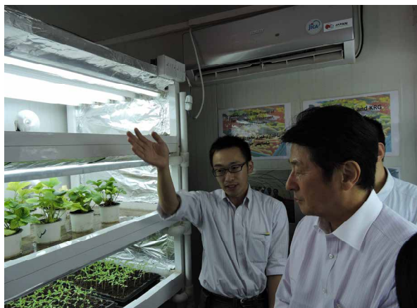
（写真）閉鎖型育苗システムを説明するJICA専門家

派遣団は、エルビル市内のゲダラシャ試験場を訪れ、関係者から説明を聴取しつつ、閉鎖型育苗システムなど関連施設を視察した。