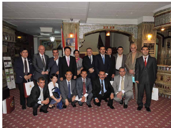
(写真) 懇談を終えて

派遣団は、クルド・日本友好議員連盟が主催する歓迎懇談会に出席し、KRG関係者、クルディスタン議会議員、学識経験者、経済界関係者等と懇談した。クルド側出席者からは、「イスラム国」への対応のためにKRG首脳との意見交換が実現できなかった事情、イラク政治プロセスにおけるKRGの役割、日本企業のクルディスタン地域に対する投資への期待、学術交流の可能性などについて発言があり、率直な意見交換を行った。